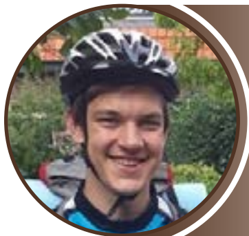
DJ Man van de oranje draad Fietsende Hollander Contactpersoon C